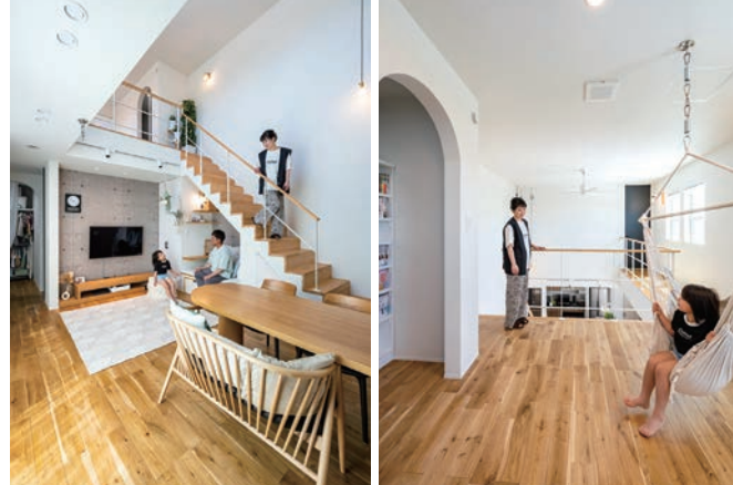
2階のフリースペースは子どもがハンモックで遊んだり、ゆったり読書できる「セカンドリビング」でもある。吹き抜けに面しているため、下で過ごしている家族の気配も伝わるだろう。