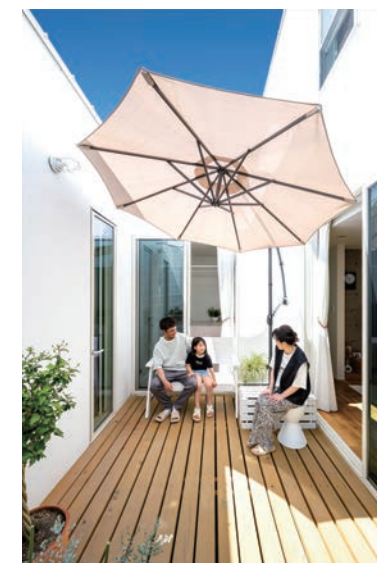
中庭があるからこそ、リビングやダイニングがより広く感じられる。晴れた日には部屋が一つ増えたかのよう。

企業DATA 株ウッドプラン 〒370-0857 群馬県高崎市上佐野町824-1 TEL.027-326-2348 U R L https://www.woodplan.jp/ E-mail contact@woodplan.jp