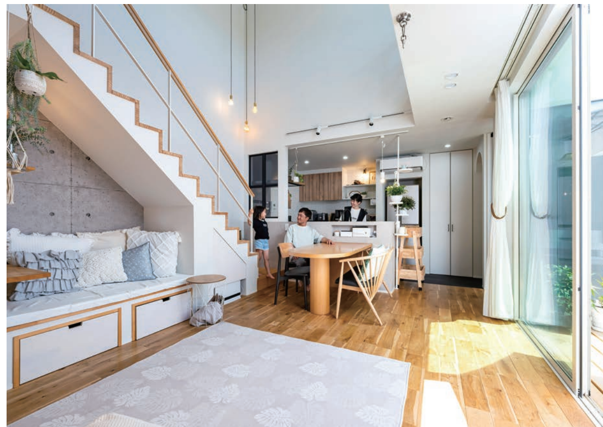
白と木目、そしてコンクリート柄をはじめとしたグレーの3色でコーディネートした邸内。リビングには「空間が窮屈になるから」とソファを置かない代わりに、ボックス階段の下にソファを設計。段差に腰掛けてTVを見たり、寝転がって寛げるなどご家族から重宝されているそう。(この見開き頁の写真はY氏邸)