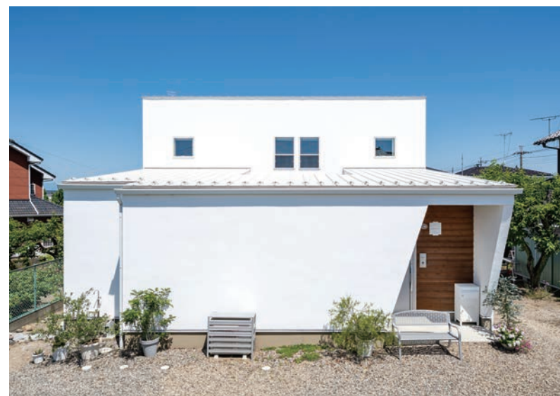
曇一つない青空の下で映える真っ白な塗り壁。美容室兼用だが基本は予約制のため、あえて店舗感を強調せずシンプルにデザイン。玄関周りにあしらった鋸張りのレッドシダーがアクセントに。

※外気温0℃、エアコン設定温度20℃の場合。 気密・断熱性を高めることで、温度差の少ない室内環境に。