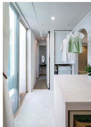
美容室とも行き来できるランドリールーム。固定の作業台はアイロン掛けや衣類を畳むのに便利。