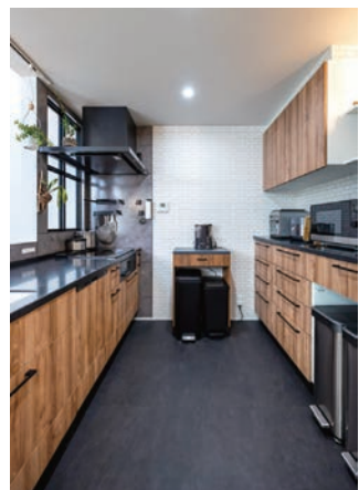
他とは違い、黒と濃い木目柄で「カッコよさ」を意識したキッチン。格子窓は奥様のお気に入り。