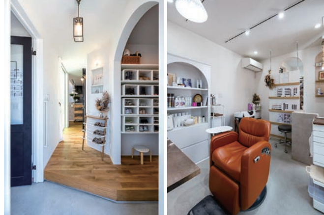
共有の玄関から繋がる奥様運営の美容室「Pomul&forum (ポムル&フォルム)」。「お客様にとって宝物となるような時間やスタイルをカタチにしたい」との想いが込められている。